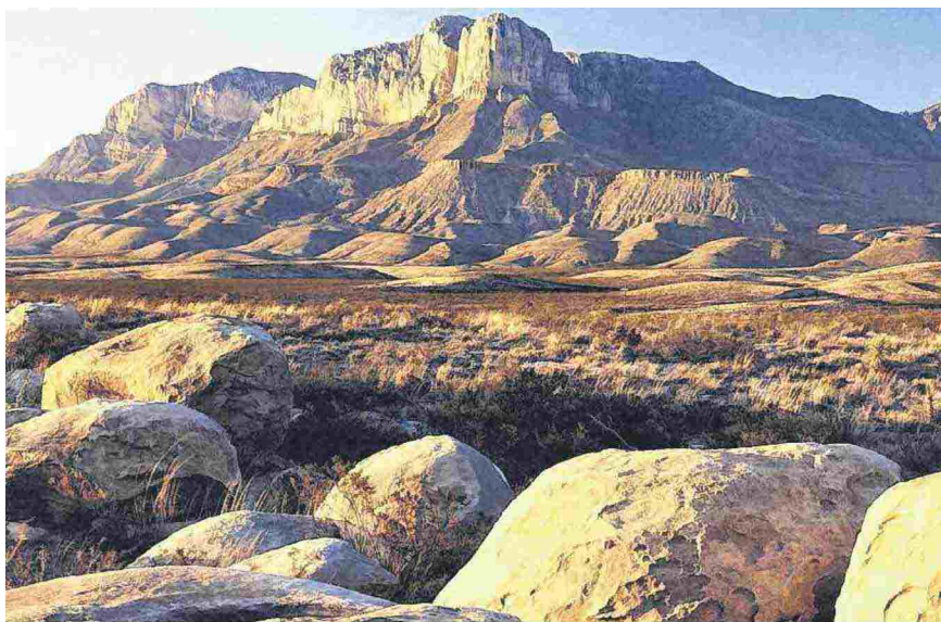
Uno scorcio del Guadalupe National Park in Texas

L'intervista Nel nuovo romanzo dello scrittore uno sguardo impietoso sul passato del suo Paese: «Il Texas è il perfetto esempio del modo in cui gli Stati Uniti sono nati: prendi la terra, prendi la terra, prendi la terra»